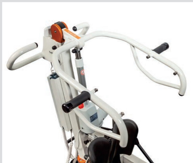
Zusätzliche Gurtaufnahmepunkte am Bügel