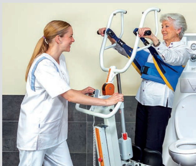
Ergonomische Handgriffe tragen zum guten Fahrgefühl für die Pflegekraft bei