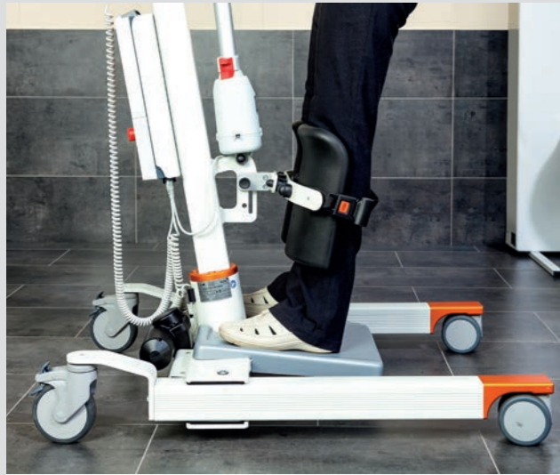
Flexible, höhenverstellbare Kniepolster mit Sicherheitsgurten, speziell anpassbar an kleinere Bewohner