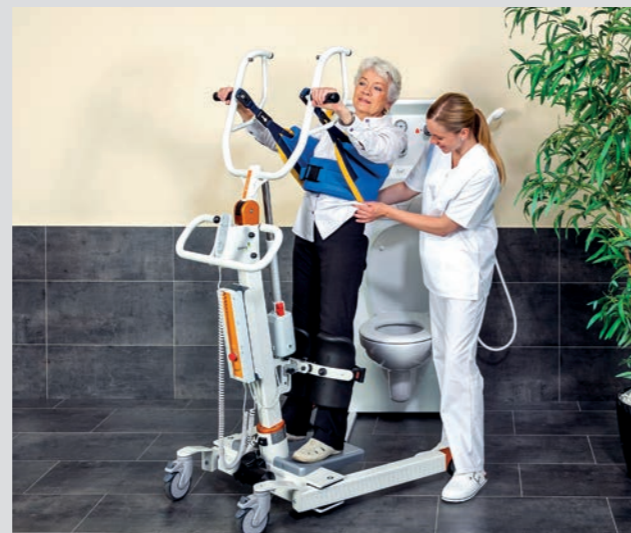
Kann problemlos für den Toilettengang und Abduschen des Gesäßbereiches verwendet werden