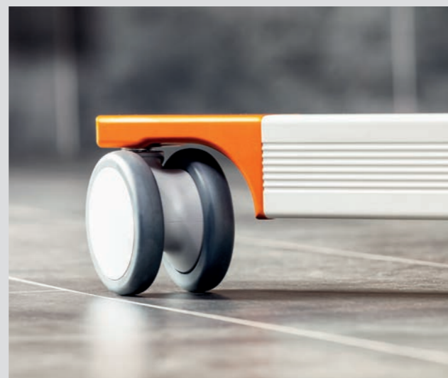
Leicht zu fahrende Doppelrollen, davon zwei feststellbar für erhöhte Sicherheit beim Aufrichten