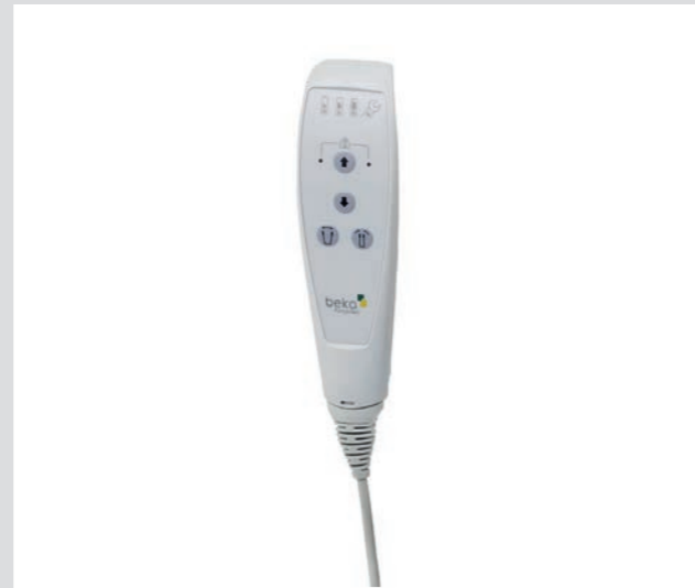
Kabelfernbedienung mit Symbolen für alle Funktionen des Aktivlifters sowie Akkuladestatus